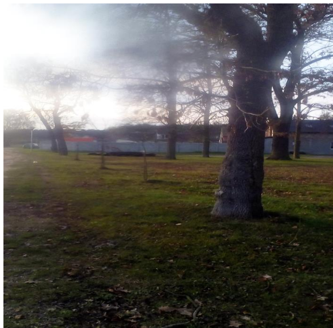
Zdjęcie nr 5