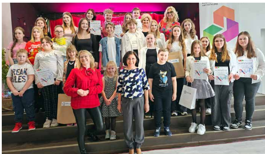
Uczestnicy LKA – PIOSENKA