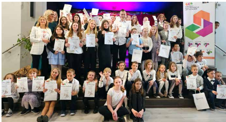
Uczestnicy LKA – RECYTACJA