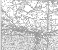
MAPA DO CELÓW PROJEKTOWYCH