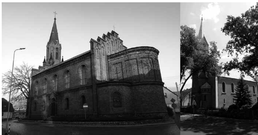
Kościóły w Czerwieńsku i Nietkowie (zdjęcie świątyni w Czerwieńsku wykonane w styczniu 2019 r. przez Marka Mizerę oraz współczesna fotografia jej odpowiednika w Nietkowie autorstwa Anny Wojnarowskiej)

Znamienne, choć nie powinno to dziwić, że korespondencja dotycząca interesującej nas kwestii trafiła również do nadzorującego antykościelną politykę na terenie powiatu zielonogórskiego, obejmującego administracyjnie zarówno Czerwieńsk, jak i Nietków – Komitetu Powiatowego PZPR w Zielonej Górze. Tam zapadały bowiem najważniejsze w wymiarze lokalnym decyzje, nie tylko związane z omawianymi tu iluminacjami świetlnymi, ale również m.in. o możliwości odbycia i przebiegu poszczególnych procesji na terenie Czerwieńska. Przykła-