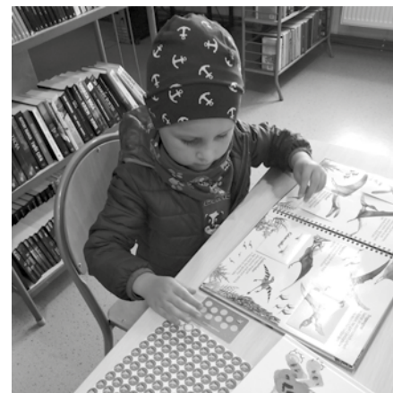
Uczestnicy ogólnopolskiej kampanii „Mała książka – wielki człowiek”

Patrycja Tietz-Piotrowicz MGBP Czerwieńsk