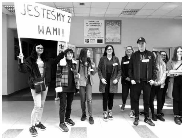
Uczniowie wsparli dziś (15.04) swoich nauczycieli

Po piąte, kontakty z rodzicami, wszystkie rady pedagogiczne, spotkania zespołów wychowawczych, przedmiotowych i innych, szkolenia, spotkania ze specjalistami.