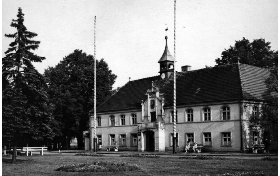
Siedziba Osiedlowej Rady Narodowej, a zarazem biblioteki w Czerwieńsku na pocztówce, której druk zlecono w 1965 r.