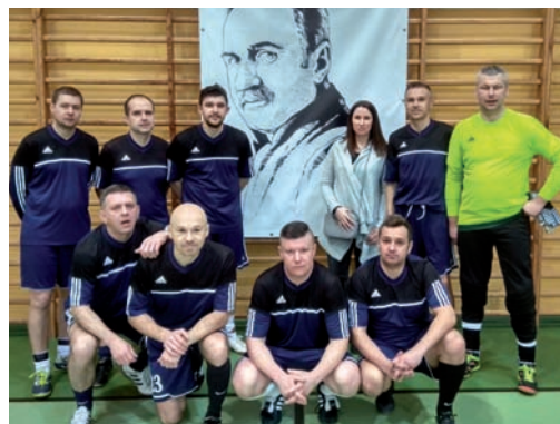
Lubuszanie Zielona Góra