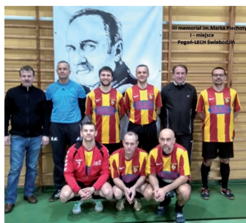
Pogoń Lech Świebodzin