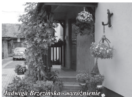
Jadwiga Brzezińska - wyróżnienie