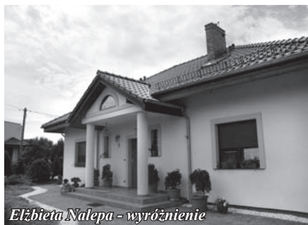
Elżbieta Nalepa - wyróżnienie