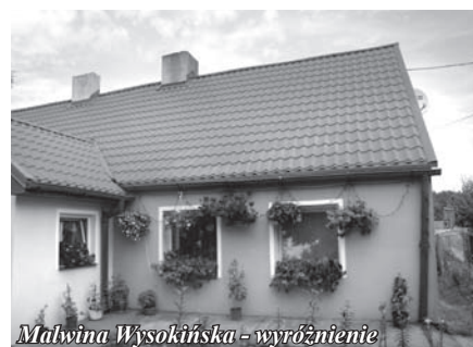
Malwina Wysokińska - wyróżnienie