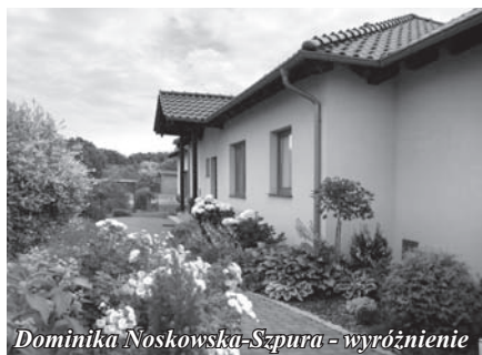
Dominika Noskowska-Szpura - wyróżnienie