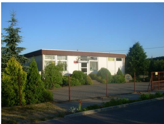
Zdjęcie nr 3: Niepubliczne przedszkole w Laskach

Niepubliczne Przedszkole – wybudowane po powodzi w 1998 roku przez Club Rotary District 1830. Przedszkole prowadzi po powodzi Stowarzyszenie Mieszkańców Lasek i w większości finansowane jest z dotacji pochodzącej z budżetu gminy. Przedszkole przeznaczone jest wyłącznie na funkcje oświatowe i na dzień dzisiejszy uczęszcza do niego 26 dzieci.