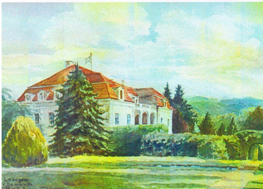
Ryc. nr 1. Pałac w Laskach

Do tego czasu mieszkali w części domów, uprawiali pola, zbierali plony – część posiadłości pozostawili Polakom. Zanim jednak opuścili wieś, żołnierze radzieccy w pokazowy sposób spalili pałac w Laskach.