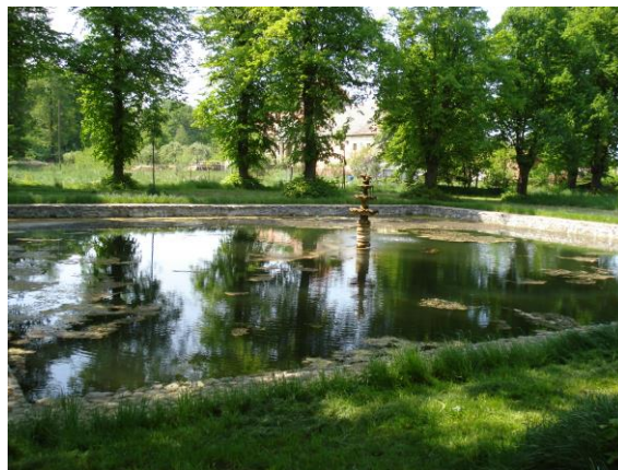
Zdjęcie nr 6: Park z fontanną

Więszą część parku zajmowały założenia krajobrazowe, tworząc w części zachodniej polanę przeciętą rowem wypełnionym wodą, która otacza ozdobną wyspę. Wprowadzono równocześnie obok rodzimych drzewa aklimatyzowane tj. tulipanowce, daglezie, lipę amerykańską, cypryśnik błotny i klon srebrzysty. Od wschodniej części znajdowały się aleje otaczające z trzech stron czworokątny basen. Z reliktowych założeń barokowych do dnia dzisiejszego przetrwały grabowe szpalery tworzące tunel z zarośniętych koron. Odnaleźć tu także można wiele gatunków drzew i krzewów, które posiadają cechy właściwe pomnikom przyrody. Aktualnie trwają prace projektowe nad rewitalizacją parku.