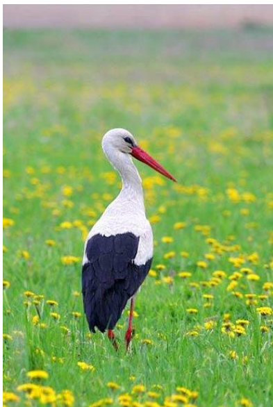
Zdjęcie nr 2: Bocian biały

Świat zwierzęcy na terenie gminy jest bogaty w gatunki faunistyczne, szczególnie w grupie bezkręgowców i ptaków, ze względu na dolinę Odry, która stanowi obszar użytków z bardzo indywidualną fauną.