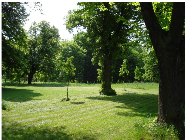
Zdjęcie nr 1: Zabytkowy park

W miejscowości Laski odnaleźć można zabytkowy park, który założony został