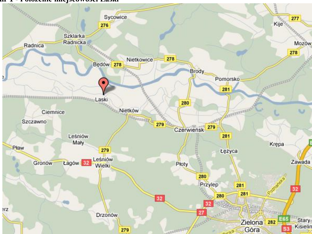
Mapa nr 1 - Położenie miejscowości Laski