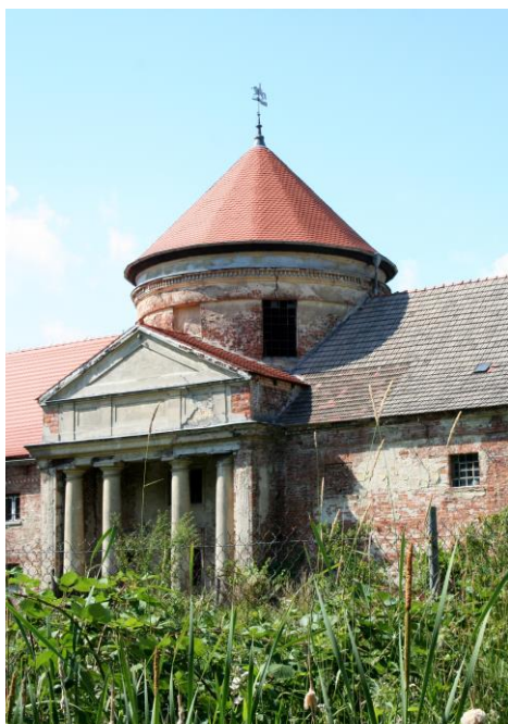
Zdjęcie nr 5: Zabytkowa Oranżeria

Osobliwością miejscowości Laski, usytuowaną na zachodnim krańcu wsi, jest park