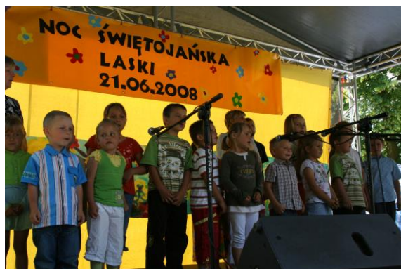
Zdjęcie nr 7: Festyn „Noc Świętojańska”

Jest to rytuał związany z wiciem wianków. Występują tam gry, zabawy dla młodzieży, koncerty zespołów śpiewaczych, zabawa taneczna i konkurs na najpiękniejszy wianek świętojański.