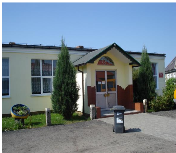
Zdjęcie nr 4: Wiejski Dom Kultury