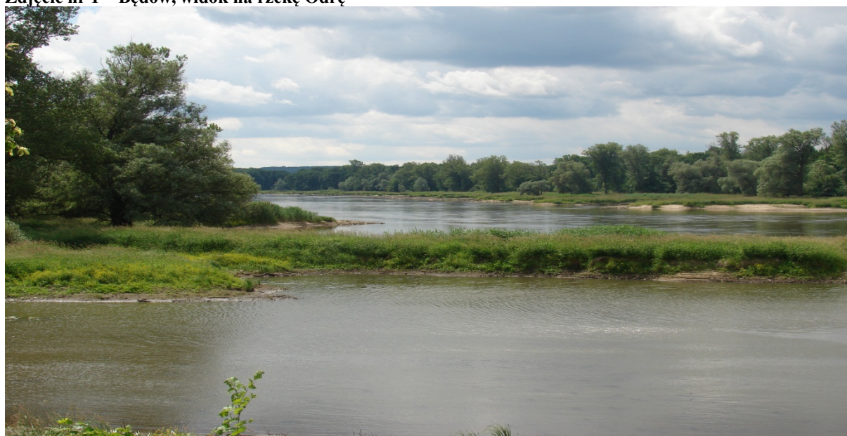
Zdjęcie nr 1 – Będów, widok na rzekę Odrę