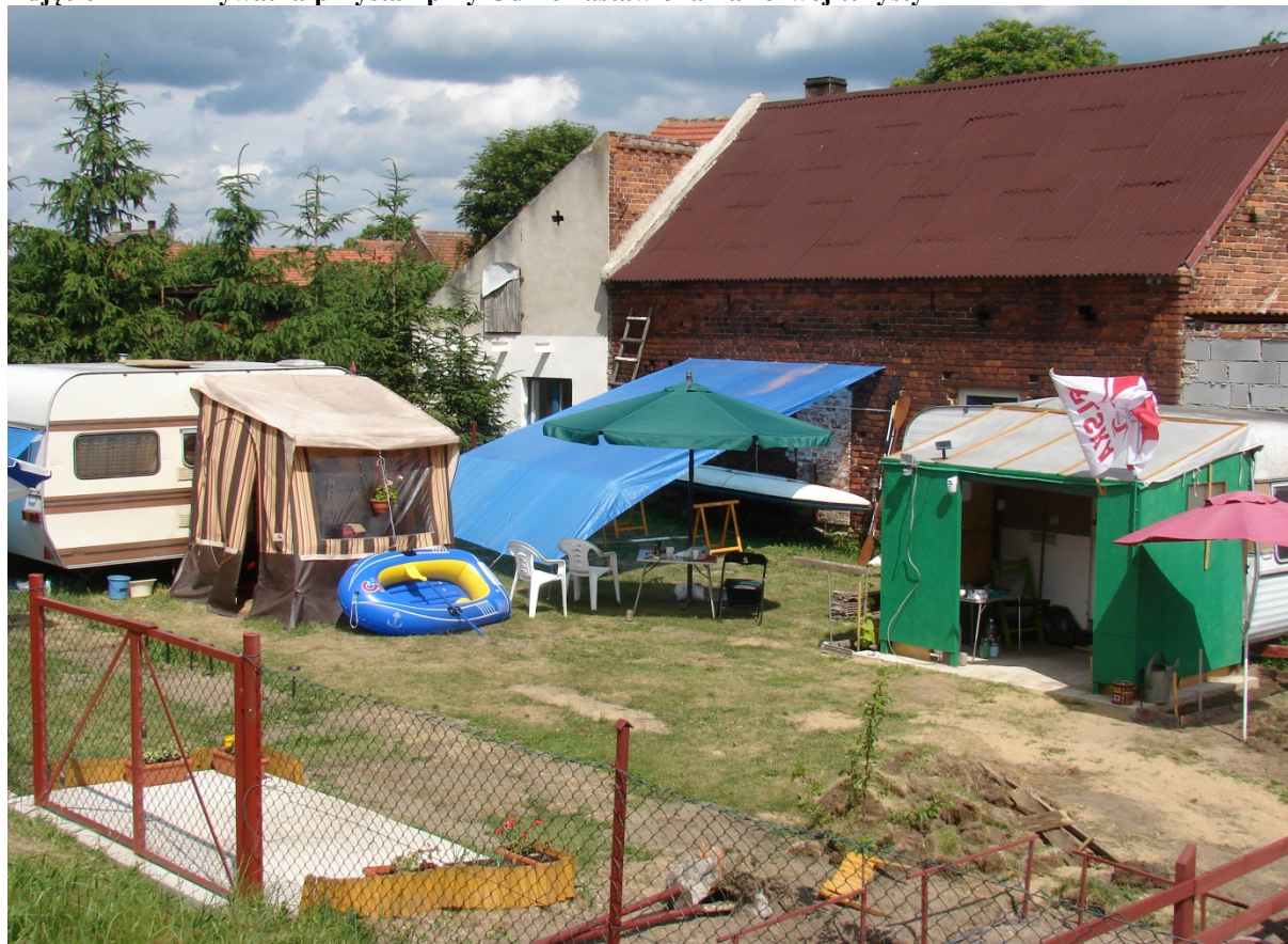
Zdjęcie nr 12 - Prywatna przystań przy Odrze nastawiona na rozwój turystyki