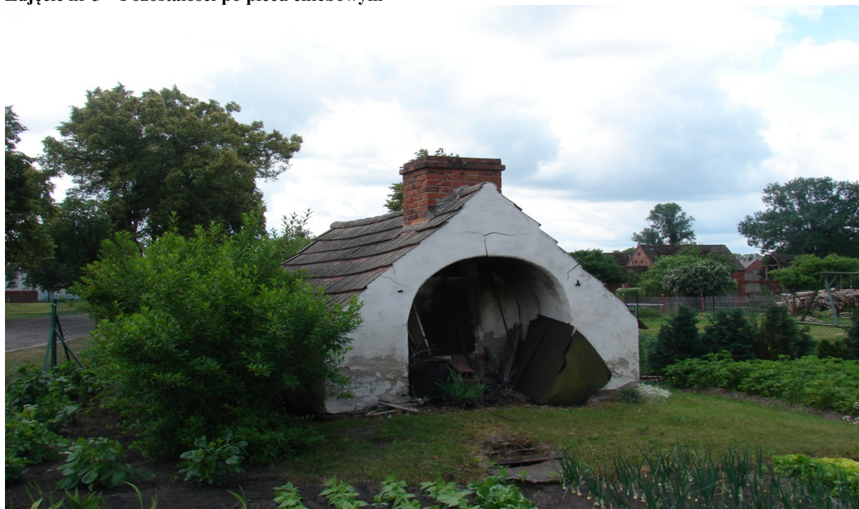
Zdjęcie nr 5 – Pozostałości po piecu chlebowym