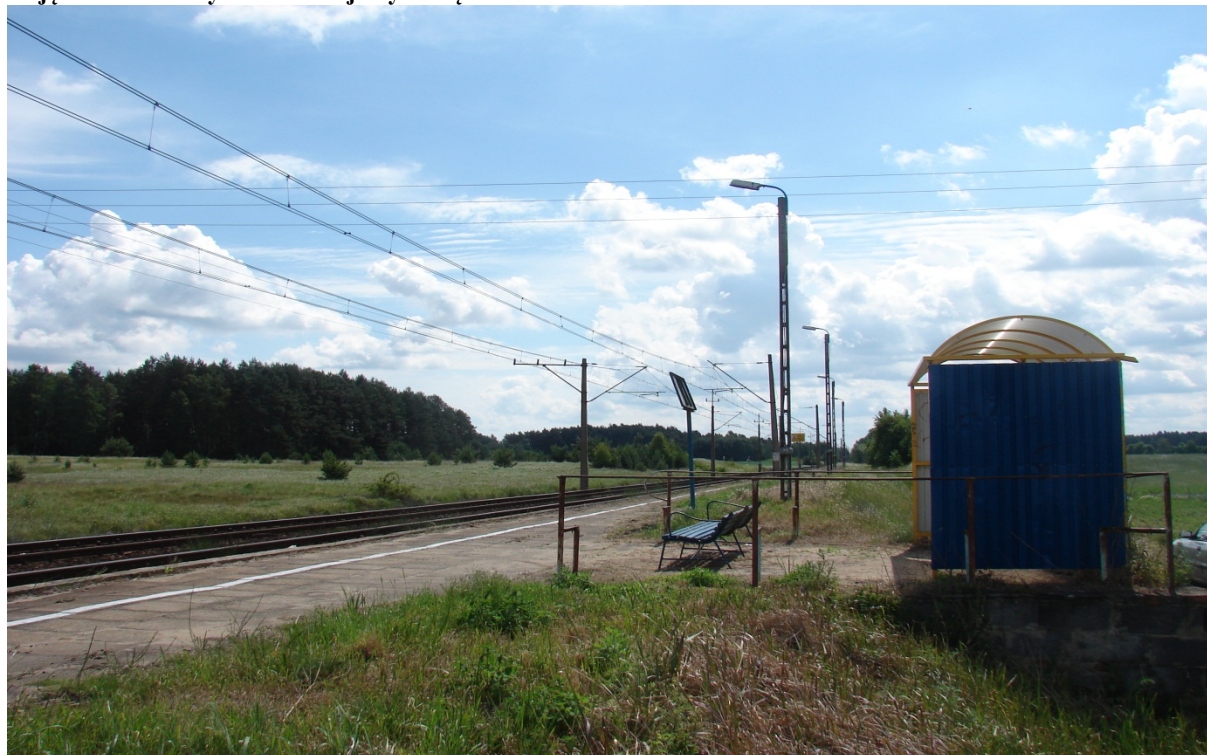
Zdjęcie nr 4 – Przystanek kolejowy w Będowie