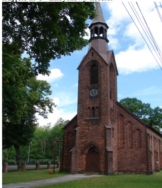
Zdjęcie nr 8 - Zabytkowy kościół