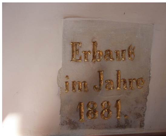
Zdjęcie nr 10 - Napis upamiętniający rok rozpoczęcia budowy kościoła