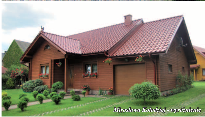
Mirosława Kołodziej - wyróżnienie