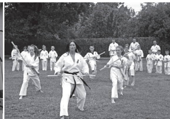
LEŚNIÓW WIELKI 13-06-2015