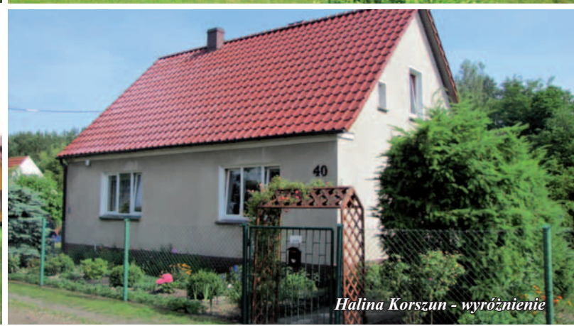
Halina Korszun - wyróżnienie