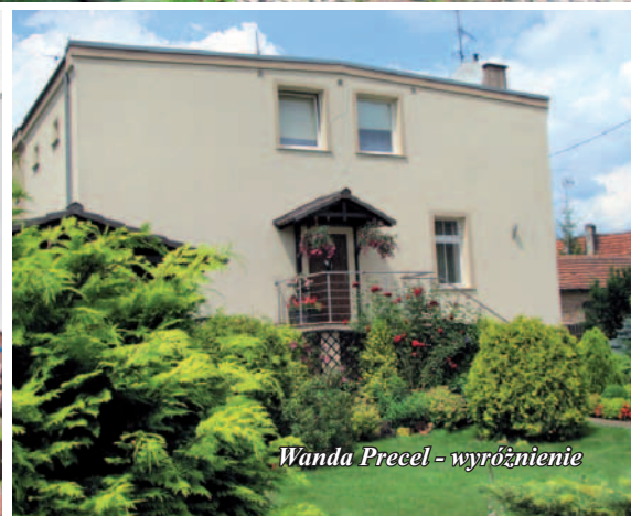
Wanda Precel - wyróżnienie