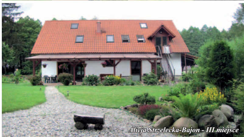
Alicja Strzelecka-Bajon - III miejsce