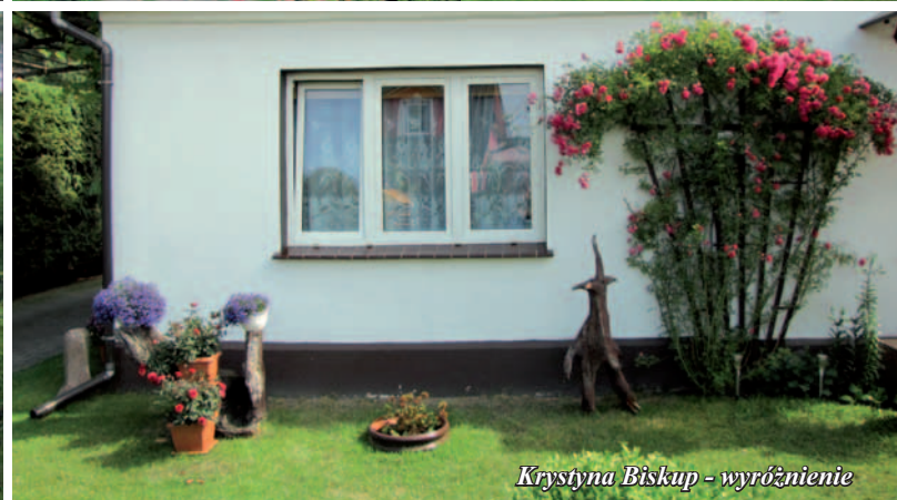
Krystyna Biskup - wyróżnienie