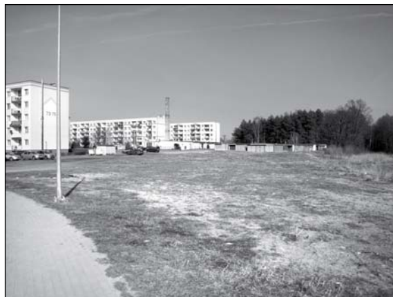
To miejsce niebawem zmieni swój wygląd

A.S.: Panie burmistrzu wiosna za pasem. Niedługo zazielenią się brzegi naszego akwenu i tylko patrzeć jak mieszkańcy wylegną na alejki. Coraz więcej osób, także z okolic, będzie chciało pospacerować