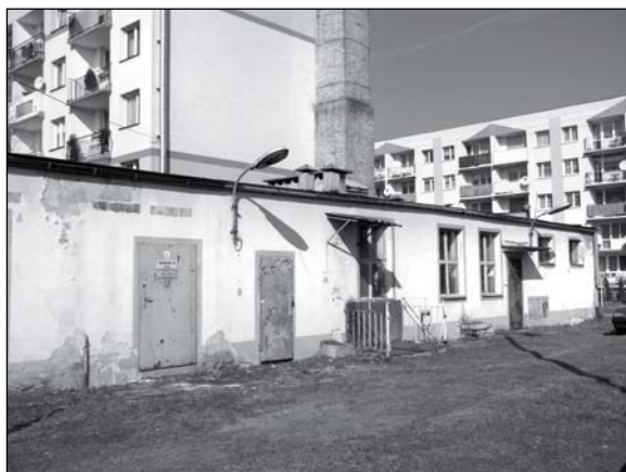
Jak wykorzystać ten obiekt?

P.I.: Bardzo dziękuję, oczywiście je odwzajemniam i za pośrednictwem naszej gazety składam również serdeczne życzenia wszystkim mieszkańcom naszej gminy. Niech będą spokojne, radosne i miłe. Wesołych Świąt!