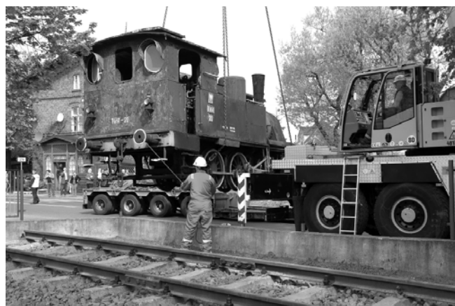
Parowóz unoszący się ponad Czerwieńskiem (26.04.2014 r.)

Grupa zielonogórska przygotowuje obecnie pod nadzorem konserwatorskim specjalistów z Muzeum Kolejnictwa