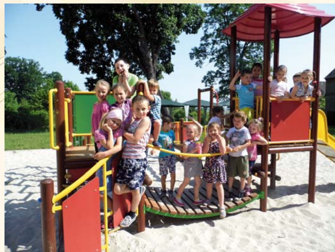
Plac zabaw dla dzieci w Nietkowie