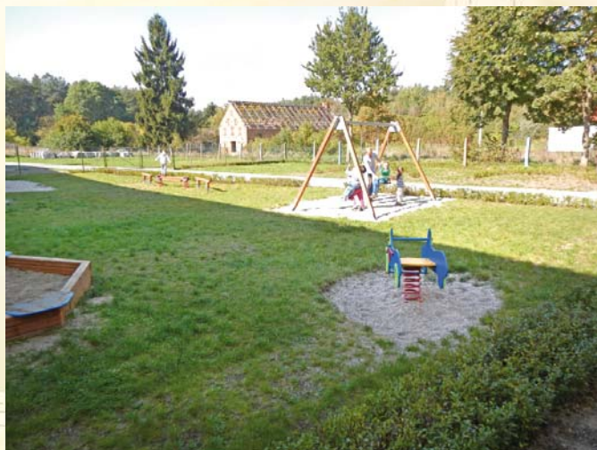
Plac zabaw dla dzieci w Nietkowicach

Dyrektorzy gminnych placówek oświatowych