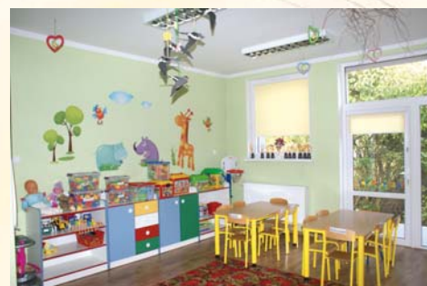
Przedszkole w Czerwieńsku

nie dla najmłodszych. Powstają place zabaw i zakątki rekreacyjne, a dzieje się to za sprawą mądrego gospodarowania funduszami sołeckimi i korzystaniem z programów pomocowych jakimi objęte są obszary wiejskie. Dostrzegamy wkład i dobre decyzje lokalnych środowisk, rad sołeckich i stowarzyszeń, które również wnoszą swój wkład w podnoszeniu jakości edukacji i standardu życia naszych mieszkańców. Tak powstały place zabaw przy szkole podstawowej w Nietkowie, Leśniowie Nietkowicach, Płotach i Laskach. Inwestycje w obiekty i zaplecze oświatowe robią w naszej gminie olbrzymie wrażenie na każdym przyjeźdźnym turystycie. Piękne kompleksy dydaktyczno-sportowe, place zabaw, boiska to jest wielka wartość naszej bazy oświatowej, której na próżno szukać w innych gminach. Wiele działań odbywa się z dużym zaangażowaniem i wsparciem władz