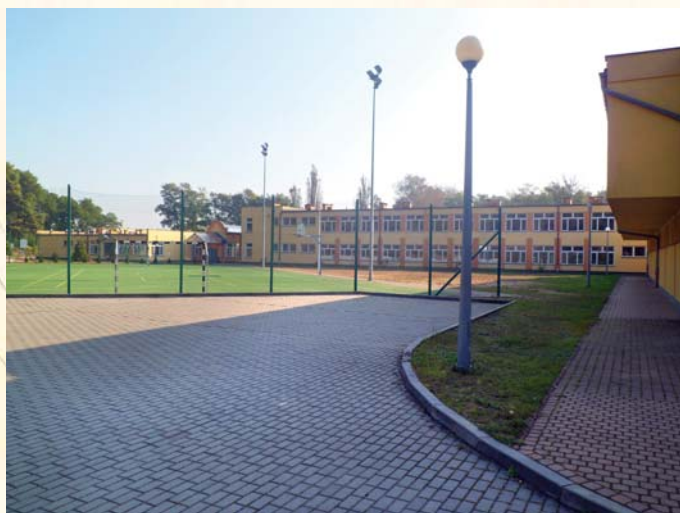
Gimnazjum im. Jana Pawła II w Czerwieńsku

Patrząc wstecz, od roku 2005, szczególnie imponująco nasze placówki oświatowe wyglądają w sferze pozyskiwania środków finansowych na rozwój bazy oświatowej z funduszy unijnych. To właśnie środki pomocowe z UE diametralnie zmieniły oblicze naszych szkół. Jeszcze nie tak dawno, 10 lat temu, przy okazji obchodów 60-lecia polskiej szkoły na ziemiach zachodnich wiele mówiło się o bolączkach i brakach naszej gminnej oświaty. Z kart szkolnych kronik można przypomnieć sobie jak wyglądały nasze szkoły, szare, bure, zimne i straszące niedoinwestowaniem. Wszyscy snu-