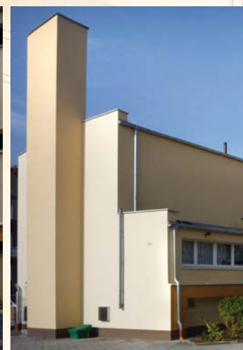
Szkoła Podstawowa w Czerwieńsku