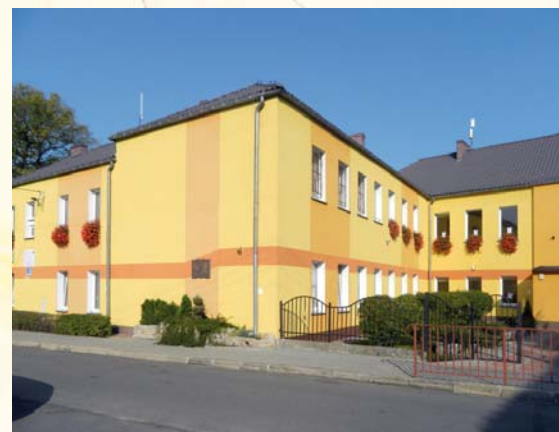
Szkoła Podstawowa w Nietkowie

w Kletzie, a piąty rok trwa i rozwija się wymiana uczniowska Gimnazjum w Czerwieńsku ze szkołą partnerską z Rothenburga ob der Tauber. Są to przedsięwzięcia współfinansowane z Euroregionu Sprewa Nysa Bóbr w Gubinie i Polsko-Niemieckiej Współpracy Młodzieży. Dzięki wspieraniu takich wymian, uczniowie z naszej gminy mają okazję doskonalić umiejętności posługiwania się językiem niemieckim i angielskim oraz poznać obyczaje, tradycję i kulturę niemieckich kolegów, co decydująco wpływa na zrozumienie młodych pokoleń i ma znaczenie dla trwałego porozumienia pomiędzy naszymi narodami.