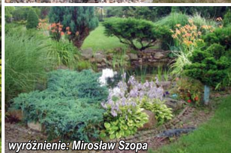
wyróżnienie: Mirosław Szopa