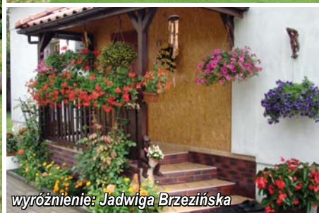
wyróżnienie: Jadwiga Brzezińska