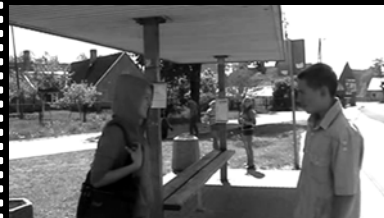
„Wilk jest wśród nas”