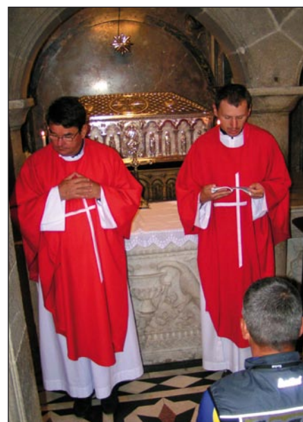
Urna z prochami Apostoła

Z wysokiego klifu widać małe kutry, jachty pod żaglami. Tak... to dla takich chwil warto było jechać setki kilometrów, przekraczać Pireneje. Na rowerowych licznikach 1058 km. Wieczorem wypite czerwone wino potęguje radość z pokonania trudności składających się na nasze Camino. Zabieramy ze sobą znalezione