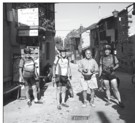
Pielgrzym z Brazylii

Zdrowych, pogodnych, radosnych i rodzinnych Świąt Bożego Narodzenia oraz szczęścia, życzliwości i wszelkiej pomyślności w 2010 Roku mieszkańcom miasta i gminy życzy Samorząd Mieszkańców Miasta Czerwieńsk