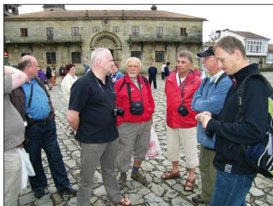
Spotkanie na placu katedralnym

na brzegu małej zatoczki muszle przegrzebka, symbolu pielgrzymów. I to właściwie już koniec, czas do domu. Po-