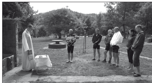
Msza w Pirenejach

Już od kilku dni towarzyszy nam słoneczna pogoda, temperatura w południe ok. 42°C. Mijamy kolejne miasta: Pampeluna, Burgos. Leon, Astorga. Zwiedzamy wspaniałe zabytki architektury sakralnej. Katedry w Burgos, Leon przytłaczają swoją monumentalnością, koronkową fasadą, przepięknymi ołtarzami i witrażami. Jednak w Astordze pałac biskupi projektu Gaudiego budzi mieszane uczucia. Przed nami widać Góry Kantabryjskie. Czeka nas najtrudniejszy podjazd na Cruz de Ferro 1493 m n.p.m. Na tle błękitu nieba odcina się potężny posąg pielgrzyma. Tam - kilka fotek, rozmowa z wędrowcami i zjazd do celtyckiej osady. Osada jest zupełnie inna, ściany budynków z miejscowego kamienia, dach, schody, balkony drewniane, trochę powykrzywiane, trochę zmurszałe. Czas zatrzymał się tutaj dawno. Galicja wita nas zielenią drzew i traw. Portomarin - do Santiago tylko ok. 100 km. Czujemy już cel