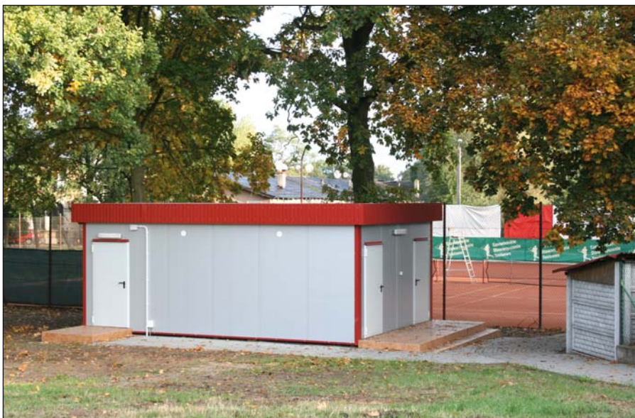
Nowy pawilon przy kortach tenisowych

Coraz ładniej wygląda również okolica Stadionu Miejskiego w Czerwieńsku. Inwestycja pod nazwą: „Moje boisko-Orlik 2012” z dnia na dzień nabiera kształtu i blasku. Firma wykonawcza narzuciła duże tempo prac i prawdopodobnie skończy budowę w określonym umową terminie. Trzymamy kciuki za tę inwestycję, gdyż już dziś wiemy jak jest ona potrzebna i oczekiwana w naszym środowisku. Co by nie mówić nie jesteśmy nowicjuszami na arenie kraju. Do tej pory powstało już ok. 900 takich obiektów w Polsce. Gminy co rusz występują z wnioskami o takie inwestycje do Ministerstwa Sportu uzasadniając je ogromną potrzebą posiadania takich w swoim środowisku. Żegnam się z państwem tradycyjnym sformułowaniem „do zobaczenia na hali”.