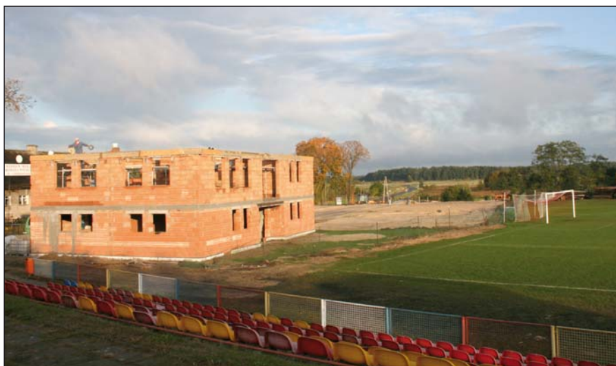
Na stadionie przy ul. Kwiatowej powstanie nie tylko boisko ze sztuczną nawierzchnią i oświetleniem, ale także nowy budynek z szatniami i zapleczem socjalnym

jest, aby dobrze przepracować zimowy okres przygotowawczy i wystartować w rundzie rewanżowej z samymi sukcesami.