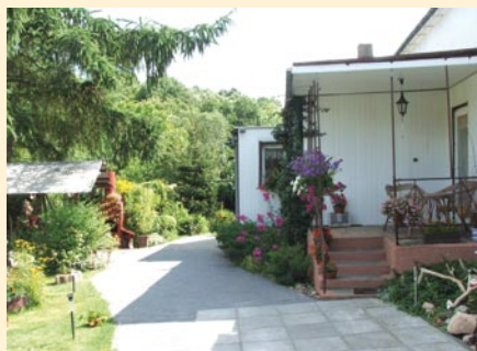
Zbigniew Jarowicz Zagórze - wyróżnienie