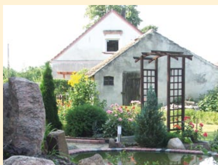
Elżbieta i Dariusz Szewców Bródki - wyróżnienie