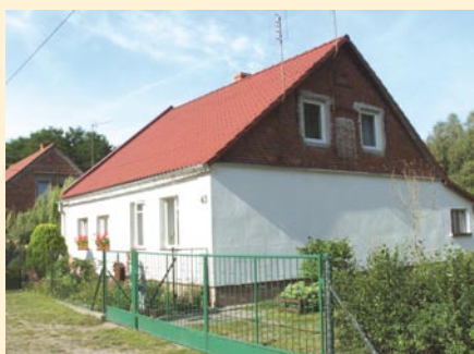
Wanda Chodor Będów - wyróżnienie