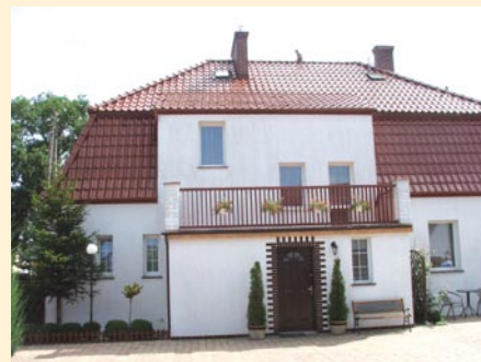
Józefa Wawro Płoty - III miejsce