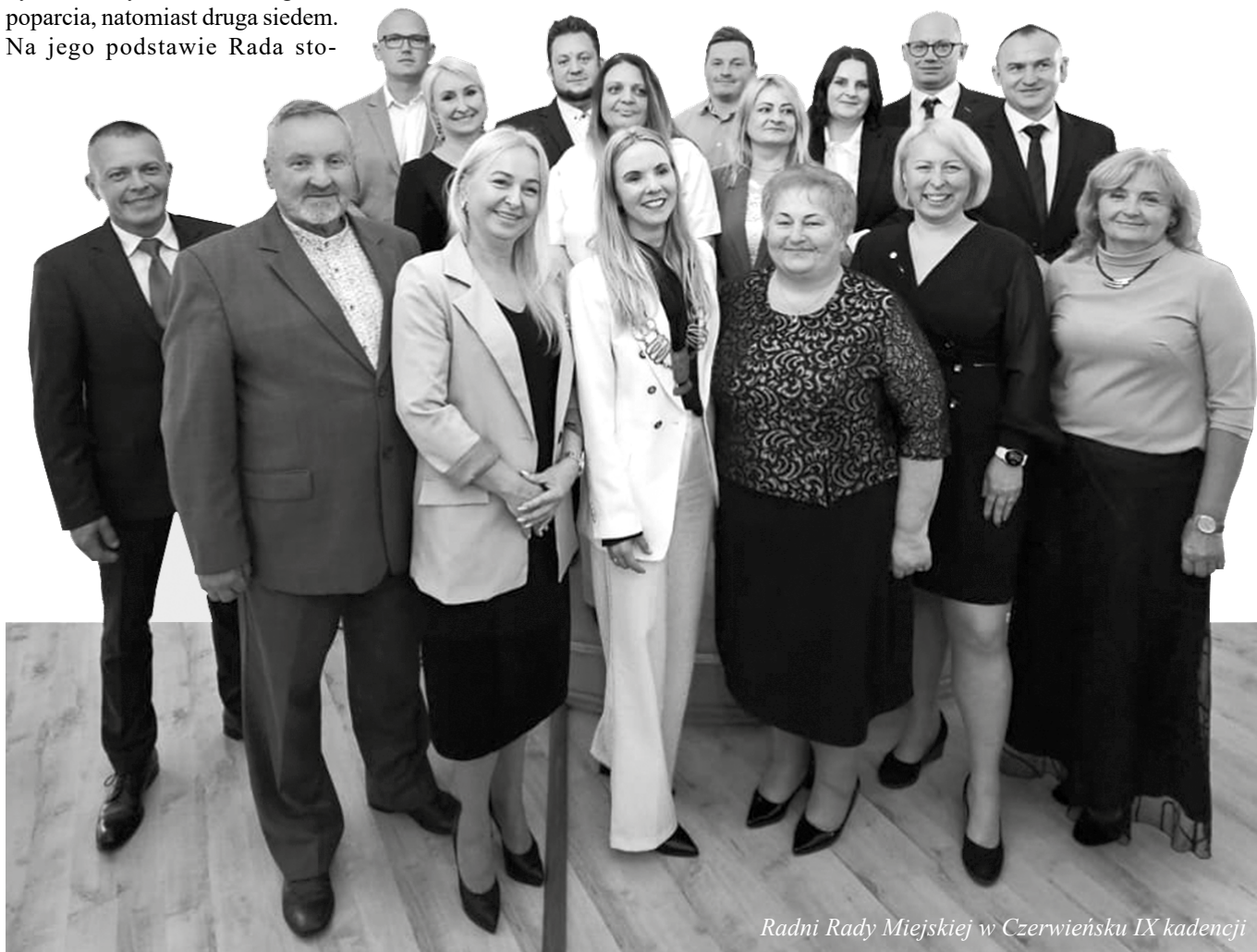
Radni Rady Miejskiej w Czerwińsku IX kadencji

Kolejne posiedzenie Rady Miejskiej wyznaczono na 16 maja br.