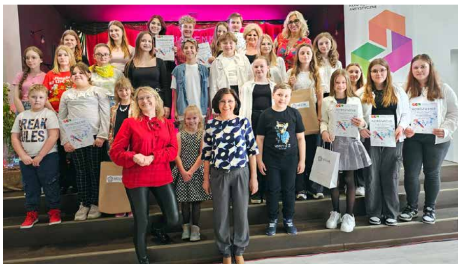
Uczestnicy LKA – PIOSENKA