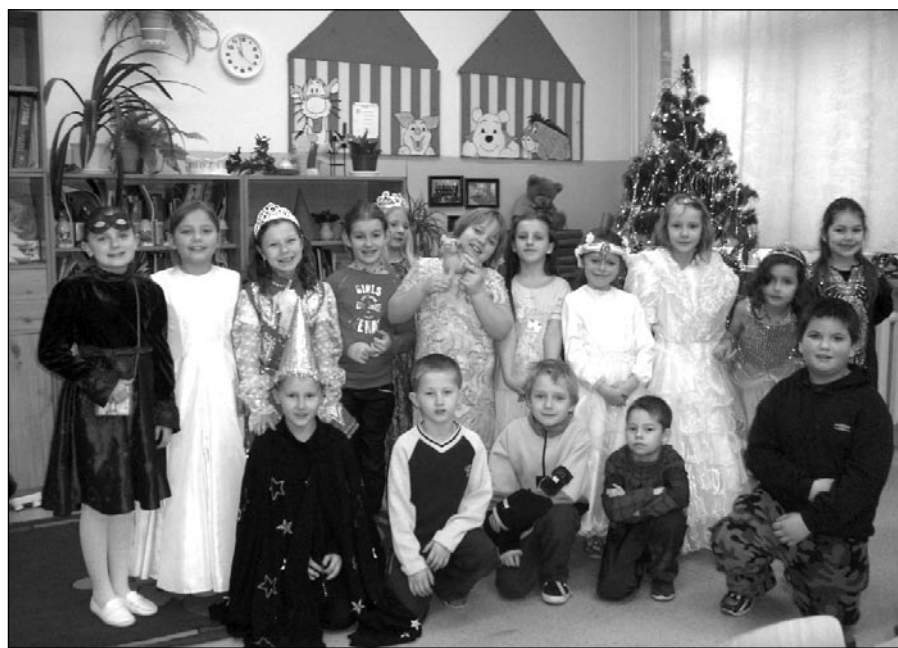
Karnawałowy bal przebierańców