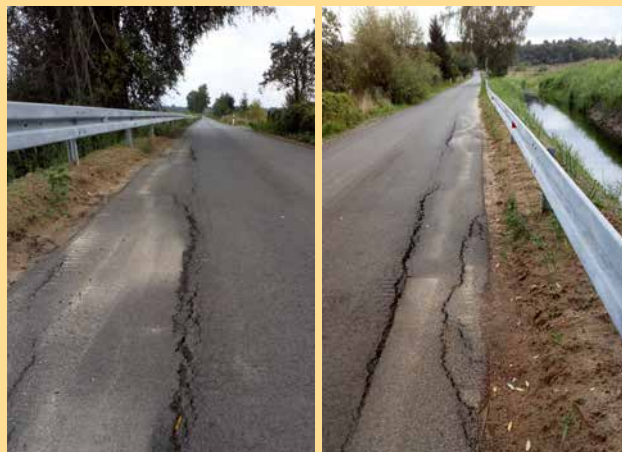
Nowa droga do Dobrzęcina już domaga się remontu (to wynik osunięcia się skarpy)