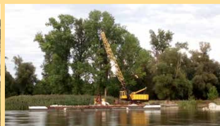
Po powierzchni rzeki nie płyną już martwe ryby. Na pierwszy rzut oka Odra wygląda jak przed tym ekologicznym Armagedonem. Jaki jest jej stan naprawdę, dowiemy za jakiś czas. Na razie widać, że po opadach i wody przybyło, więc prom może działać.