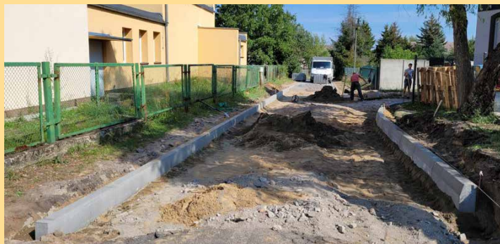
W Nietkowie remont ul. Strażackiej i Krzywej zmierza ku szczęśliwemu końcowi

Podczas wycieczki naszego reportera w oszukiwaniu pierwszych oznak jesieni obiektywowi nie umknęły i takie obrazki.