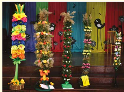
Tak prezentowały się nagrodzone palmy wielkanocne w zeszłorocznym konkursie.