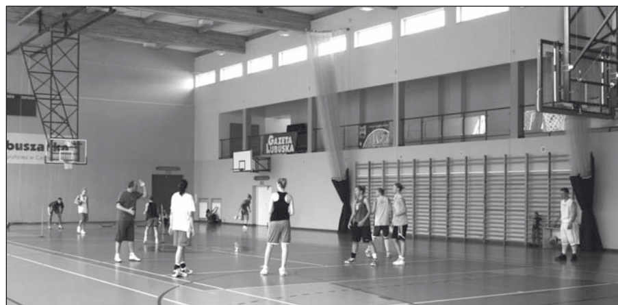
Nowe teleskopowo opuszczane kosze przydały się w treningach zespołowi Tęczy Duda Leszno

zane z budową Centrum Rekreacyjno-Sportowego (Orlik). Na ukończeniu jest inwestycja budowy budynku szatniowo-socjalnego przy kortach tenisowych przy ulicy Łężyckiej. W sezonie letnim Hala Sportowa wzbogaciła się o nowe kosze teleskopowo opuszczane z sufitu sali