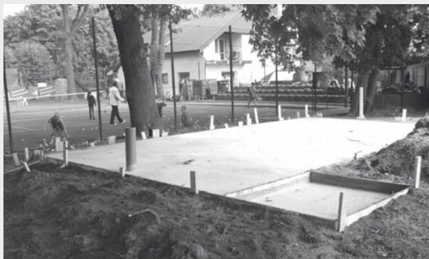
Zanim gazeta dotrze do czytelników w tym miejscu stanie nowy obiekt z szatnią i węzłem sanitarnym