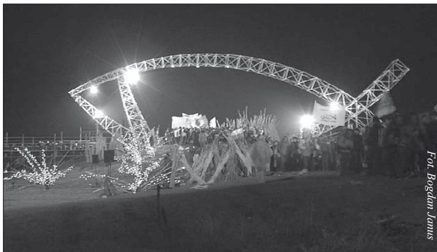
Brama Trzeciego Tysiąclecia na Polach Lednickich ma kształt ryby - symbolu Chrystusa

składają Burmistrz oraz pracownicy Urzędu Gminy i Miasta w Czerwieńsku