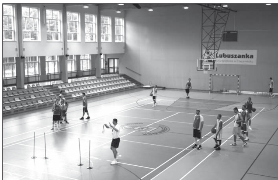
Z hali „Lubuszanka” skorzystał również zespół AZS-u Politechnika Opolska z Opola - akademicki mistrz Polski szkół wyższych