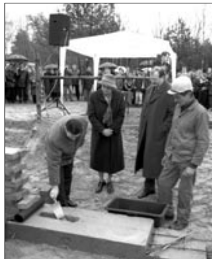
Wmurowanie aktu erekcyjnego

J.D.: Oczywiście, że pamiętam. W październiku 2003 roku ogłosiłem w gazecie