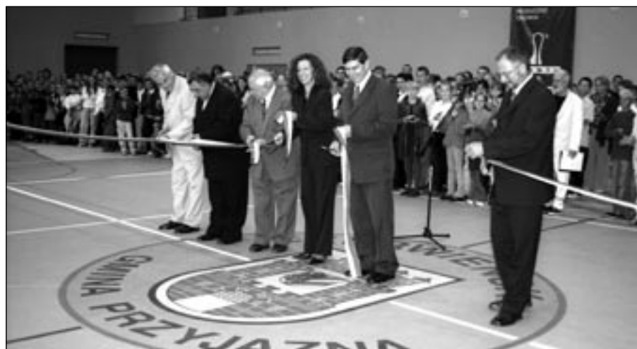
Uroczyste otwarcie nowej hali sportowej w Czerwieńsku

J.D.: Hala sportowa dotąd jest obłożona niemalże w 100% od rana do 22, a czasem nawet 23. Czasem dosłownie ledwo zdążymy ze sprzątnięciem. Taka frekwencja świadczy nie tylko o tym, że decyzja o jej budowie była strzałem w dziesiątkę, ale także o tym jak wiele pracy wymaga jej utrzymanie. Dlatego cieszę się, że mam