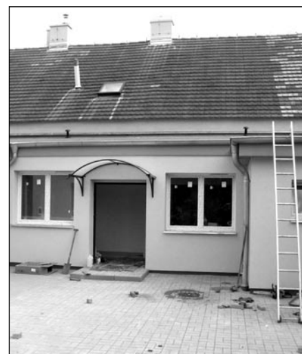
Kończy się adaptacja budynku OPS

Jeśli chodzi o salę w Nietkowie, to inwestycja ruszyła. Jak już mówiliśmy ostatnio wykonawcą jest PBO - ta sama firma, która zrealizowała nam „Lubuszanekę” i Gimnazjum. To solidny wykonawca, więc termin uruchomienia sali gimnastycznej do końca tego roku jest niezagrożony. Już 31 marca nastąpi wmurowanie aktu erekcyjnego.