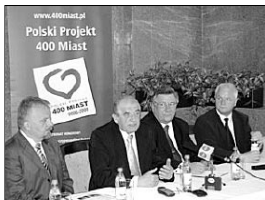
Inauguracja Polskiego Projektu 400 Miast cieszą się dużym zainteresowaniem mediów, konferencja prasowa z udziałem Ministra Zdrowia, Kielce, 28 IV 2007

Projekt składa się z kilku modułów. Najważniejszą częścią jest interwencja medyczna wśród dzieci oraz ich rodziców . W miastach województwa lubuskiego (liczących do 8 000 mieszkańców) przeprowadzane będą bezpłatne badania ciśnienia tętniczego wśród dzieci w wieku 11 lat. Każde przebadane dziecko przekaze swoim rodzicom zaproszenie na bezpłatne badania ciśnienia tętniczego, cholesterolu oraz cukru. Pacjenci, u których wykryto zmiany chorobowe, a także osoby z grupy wysokiego ryzyka wystąpienia zawału serca lub udaru mózgu będą szkoleni w ramach specjalnego programu edukacyjnego, mającego motywować do regularnego przyjmowania leków, zmiany stylu życia, a także umiejętności efektywnej współpracy z lekarzem. Interwencja antytytoniowa ma na celu zmniejszenie