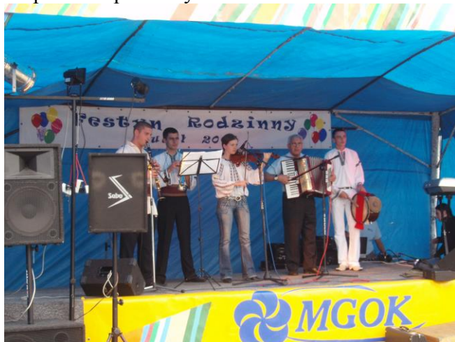
Zdjęcie nr 2: Festyn Rodzinny

Festyn wiejski odbywa się corocznie. Wspólne biesiadowanie prowokuje do wymiany doświadczeń, wzbogacania wiedzy o zaprzyjaźnionych regionach, pomaga we wspólnym organizowaniu podobnych przedsięwzięć a przede wszystkim przyczynia się do znoszenia barier w kontaktach polsko-niemieckich. W Sudole organizowany jest „Festyn Muzyki Folklorystycznej”. Zbierają się zagraniczne i miejscowe zespoły by przy wspólnym stole zaśpiewać i potańczyć.