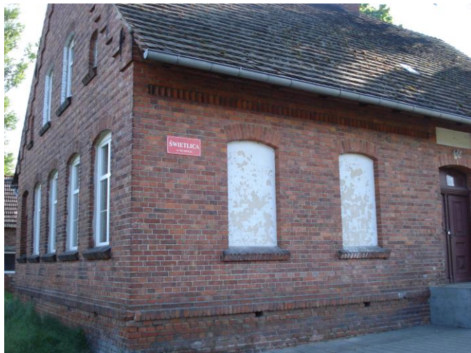
Zdjęcie nr 1: Świetlica Wiejska