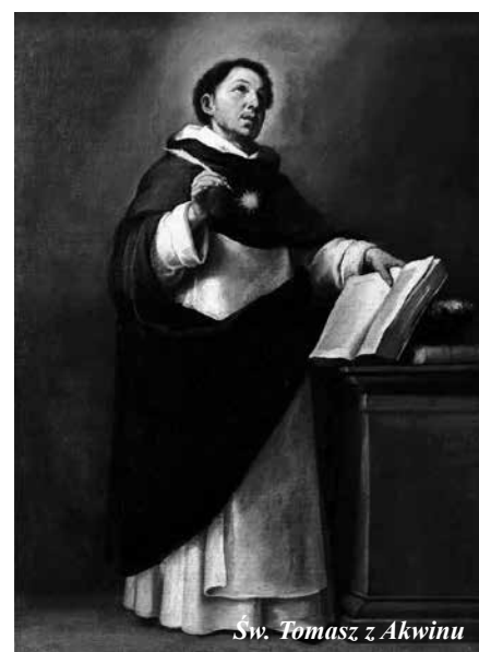
Św. Tomasz z Akwinu

Uczyni mnie poważnym, lecz nie ponurym; czynnym lecz nie narzucającym się. Szkoda mi nie spożytkować wielkich zasobów mądrości, jakie posiadam, ale Ty Panie wiesz, że chciałbym zachować do końca paru przyjaciół.